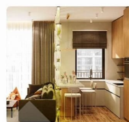
1-комнатная квартира Дом №2, подъезд №4