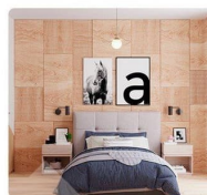
1-комнатная квартира Дом №2, подъезд №10