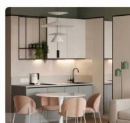
1-комнатная квартира Дом №1