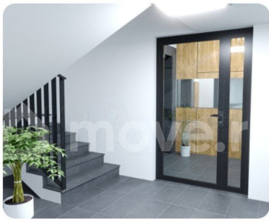
Безбарьерная среда для маломобильных групп населения.