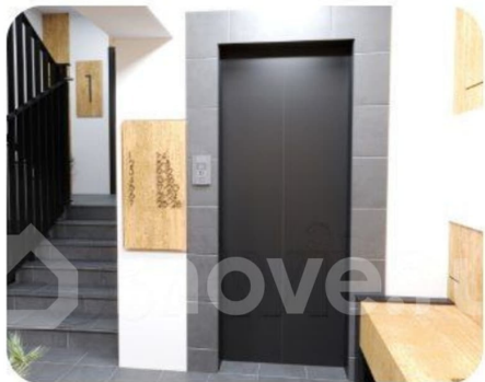
Подъезд воплощает в себе гармонию современного комфорта.