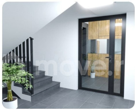
Безбарьерная среда для маломобильных групп населения.