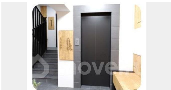
Подъезд воплощает в себе гармонию современного комфорта.