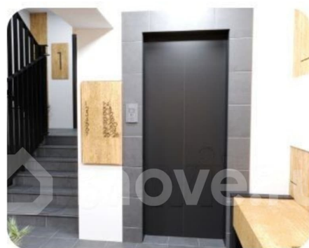
Подъезд воплощает в себе гармонию современного комфорта.