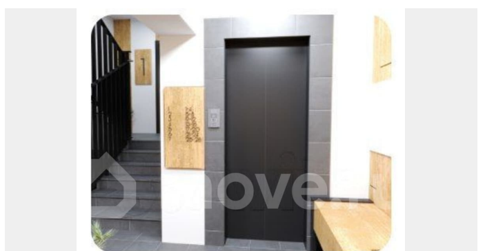
Подъезд воплощает в себе гармонию современного комфорта.